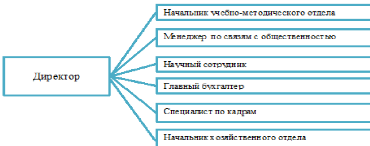
Рисунок 1 - Структура управления БФ ФГБОУ ВО «КНИТУ»

Филиал возглавляет директор. Структура управления представлена на рисунке 1.